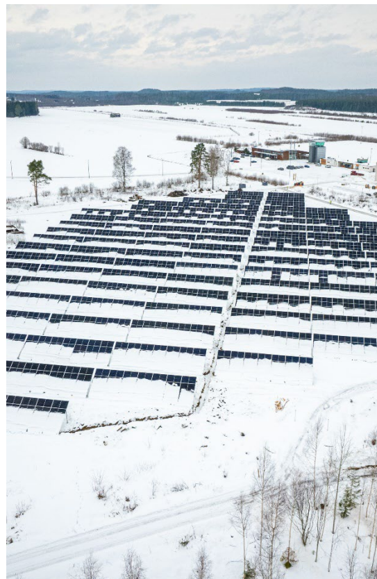
Kuva 4. Aurinkopaneeleita Joroisissa.

Vetytalouden selvittämiseen Pohjois-Savossa on myönnetty hankerahoitus Lappeenrantaan Lahden teknilliselle yliopistolle LUT. Hankkeessa tuotetun raportin avulla voidaan pitkällä aikavälillä kohdistaa toimenpiteitä vihreän teknologian käyttöönoton edistämiseen, joka edistää ilmastonmuutoksen hillintää.