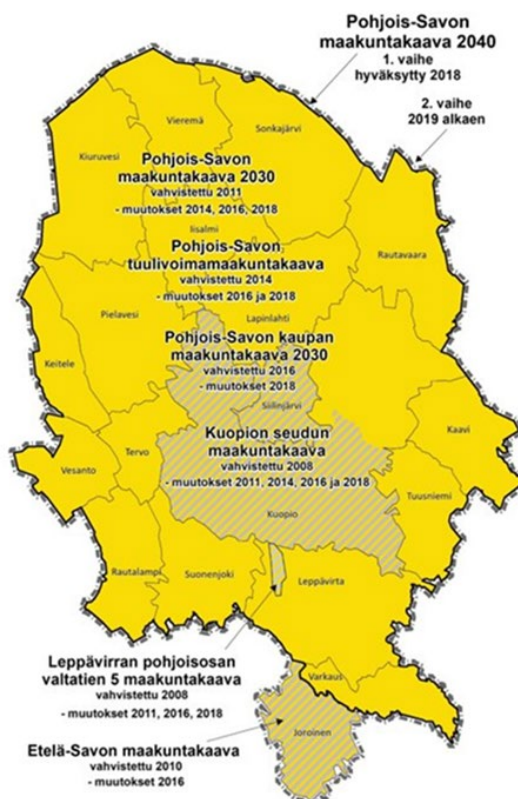
Kuva 1. Maakuntakaavoituksen nykytilanne Pohjois-Savossa.

Ehdotusvaiheessa oleva Pohjois-Savon maakuntakaavan 2040, 2.vaihe tulee nähtäville vuoden 2024 alussa. Sen saadessa aikanaan lainvoiman, vanhat kaavamerkinnot maakuntakaavasta kumoutuvat.